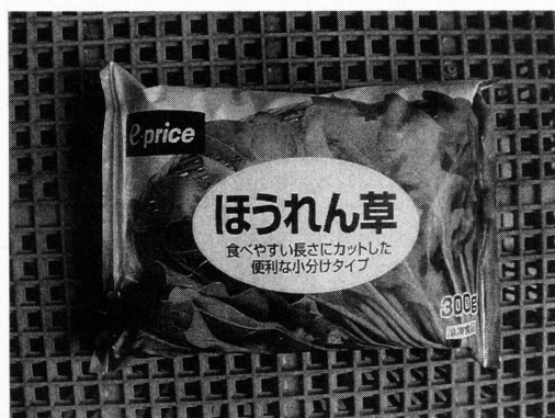
写真2. 職場の冷蔵庫に眠っている中国産の冷凍ほうれん草

れいに詰められています。陸揚げすれば日本産との区別は難しいでしょう』との衝撃的な返事が返ってきた。先日、我が家の冷蔵庫の奥に回収騒ぎのあった中国産冷凍ほうれん草が挟まっているのを見つけた。今更、購入した店に返却することもできず、職場の冷蔵庫で眠らせておくことにした(写真2)。数日後に、スーパーで冷凍野菜コーナーを見た。そこには中国産のブロッコリー、サトイモ、エダマメ、タイ産のインゲンなどが大量に積まれていたが、ほうれん草だけは見つけることができなかった。この冷凍ほうれん草はQ & Aの情報源として利用できることに加え、上述した使用禁止された農薬が検出されるかも知れず、何故か宝物のように扱っている。